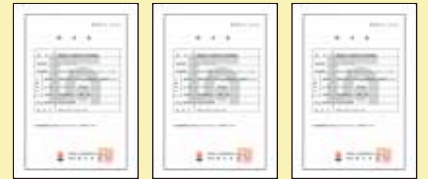
《S級認定証》 《A級認定証》 《C級認定証》