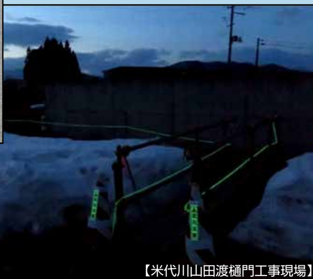
【米代川山田渡樋門工事現場】