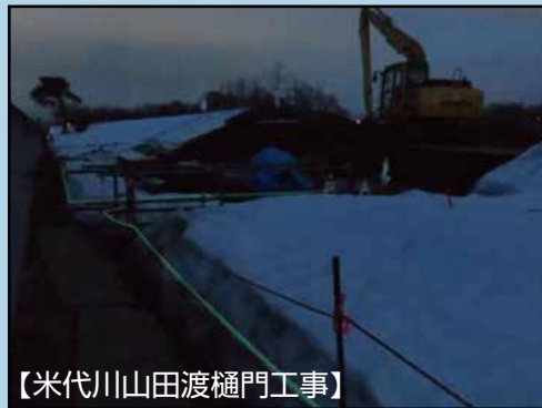
【米代川山田渡樋門工事】